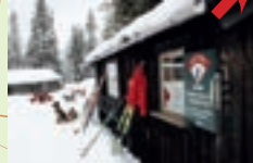
Serivering daglig fra siste helga i januar til og med påsken. Kl. 10–15.

Til Slettås to løyper. 7,6 og 9,5 km. I Slettås 17 km med løyper.